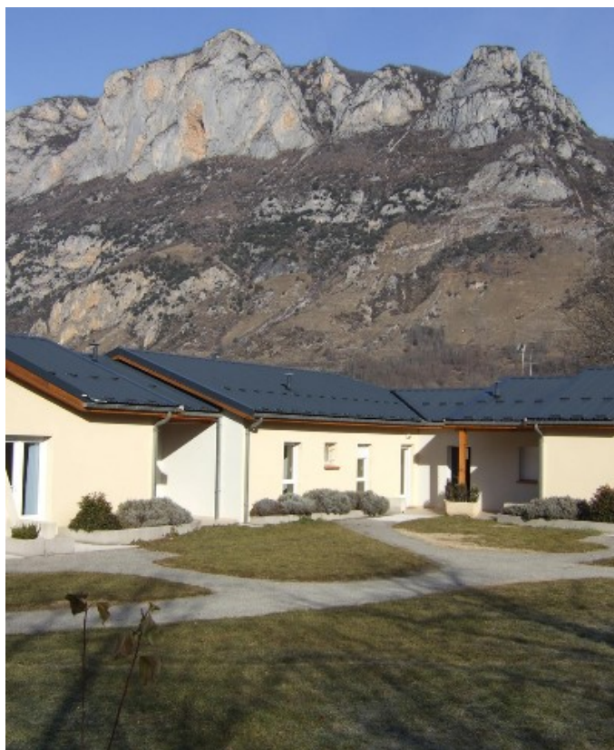
Dossier Camp IV